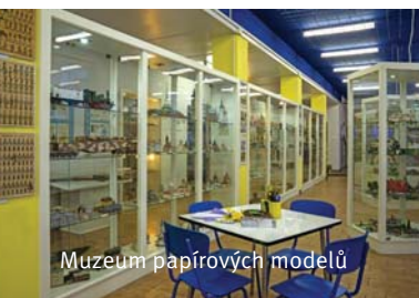
Muzeum papírových modelů